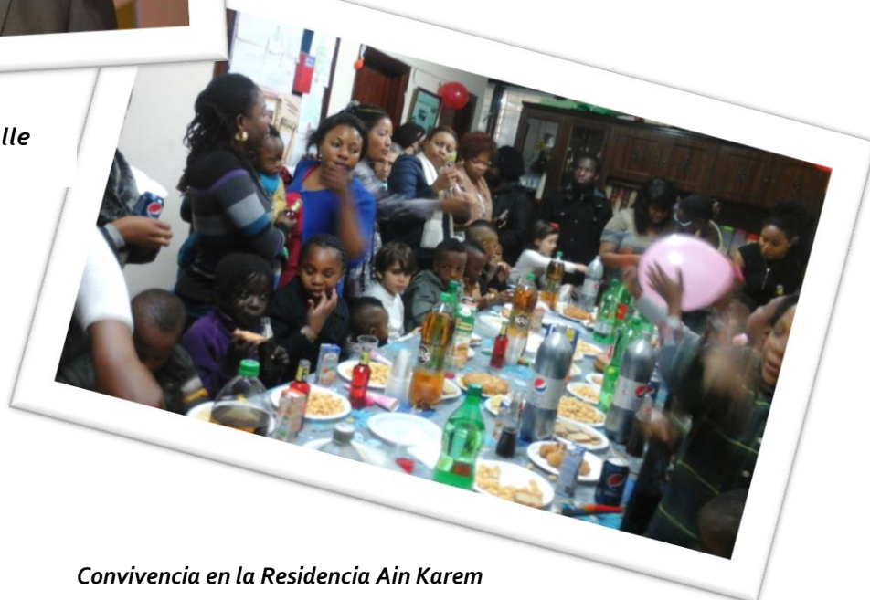
Convivencia en la Residencia Ain Karem