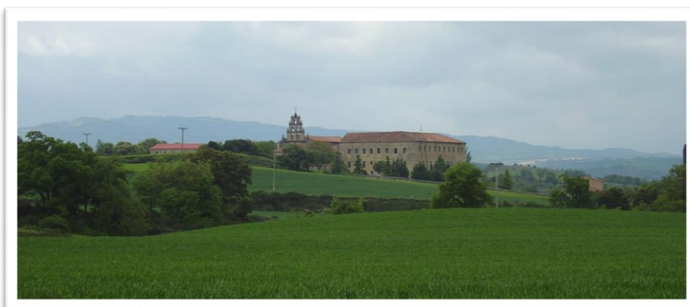
Monasterio de N. Sra. del Espino