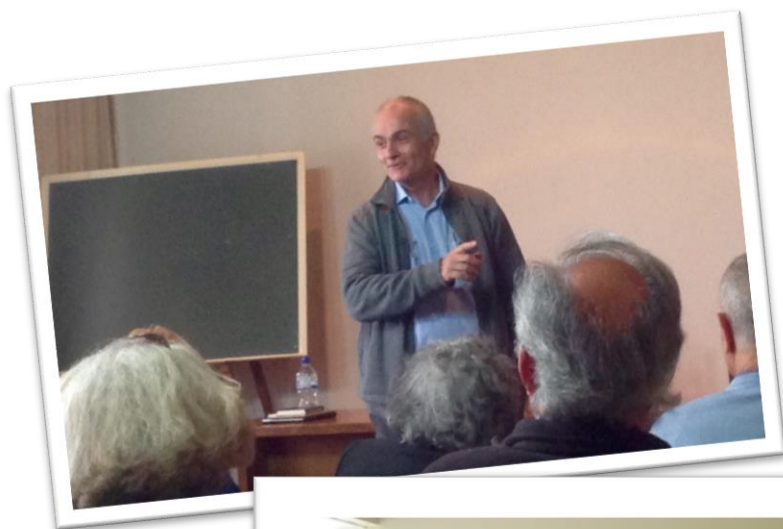
Exposición y diálogo con el P. General